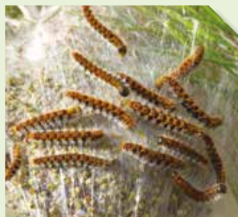
Nid de Thaumetopoea pityocampa

Attirés par cette substance sémiocchimique volatile, les mâles se retrouvent capturés dans le piège, ce qui empêche leur accouplement. Ainsi, le nombre de pontes et de futurs nids de chenilles diminuera.