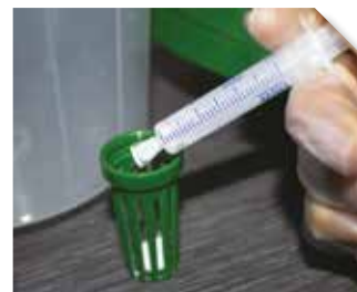
Application de PINE T PRO CAPS