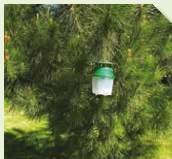
Piège Funnel contenant la phéromone PINE T PRO CAPS